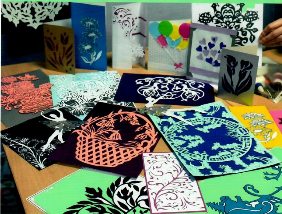
Майстер-клас «Витинанка-душа народу» Центр соціально-психологічної реабілітації дітей «Барвінок»