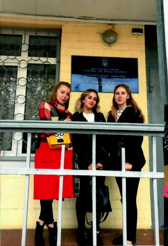
Майстер-клас «Витинанка- душа народу» Центр соціально-психологічної реабілітації дітей на Тверській